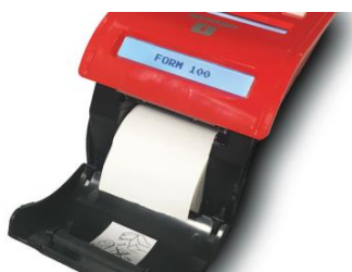
Chargement du rouleau ultra facile