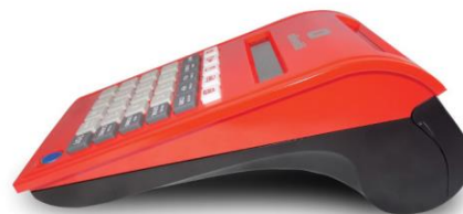
Compacité, design épuré et moderne